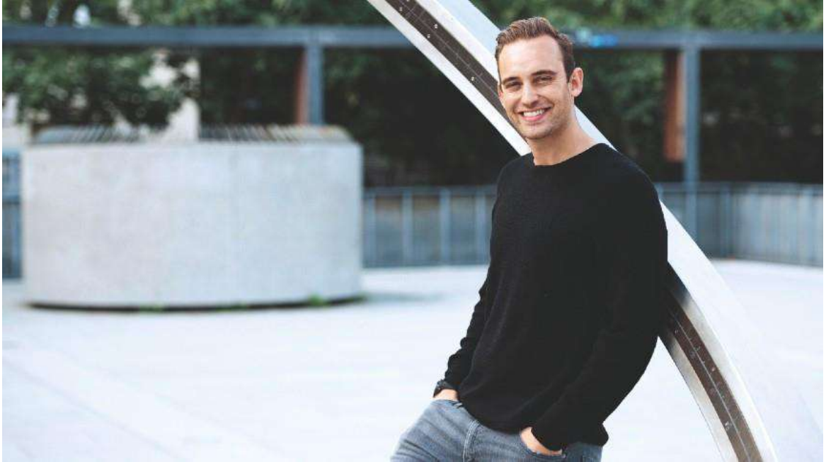
O escritor suíço Joël Dicker

Circulam pelas mais de 500 páginas do livro grupos de operadores da bolsa de valores, tribos rivais de banqueiros e corretores inescrupulosos. Isso sem contar uma aristocrata russa, Olga, viúva de um oligarca interessada em “casar bem” suas duas filhas.